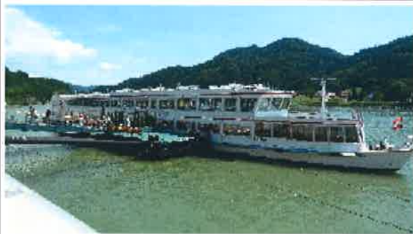
Schiffsankunft in Grein